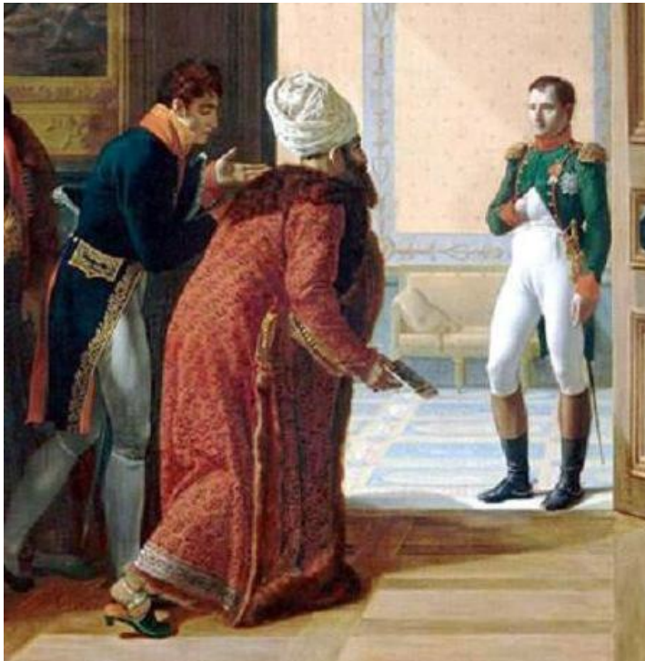
Amédée Jaubert. el Dragoman favorito de Napoleon y consejero estratégico. Aqui acompañado del enviado Persa Mirza Mohammed Reza Qazvini. 27 de Abril 1807. Detalle de una Pintura de François Mulard.

Un Dragoman tenia que tener conocimiento de diferentes culturas, idiomas, ideas y haber viajado por todos los territorios de los imperios. Esta posición toma mucho protagonismo durante el Imperio Otomano donde existía mucha resistencia entre los pueblos para aprender el idioma de otros. El Dragoman era por lo tanto un puente entre culturas y épocas, un guía que indicaba donde encontrar conocimiento a los grandes estrategas y líderes de la época.